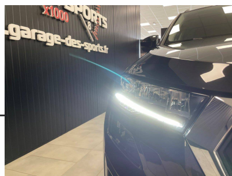
Skoda - Karoq 1.5 TSI 150ch ACT DSG7 Business