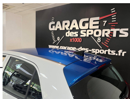
Kia - Picanto 1.2 DPi 79 ch BVM 5 Active