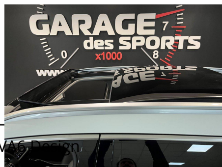
Kia - Sorento 1.6 T-GDi Hybride Rechargeable 265 ch 7pl 4x4 BVA6 Design